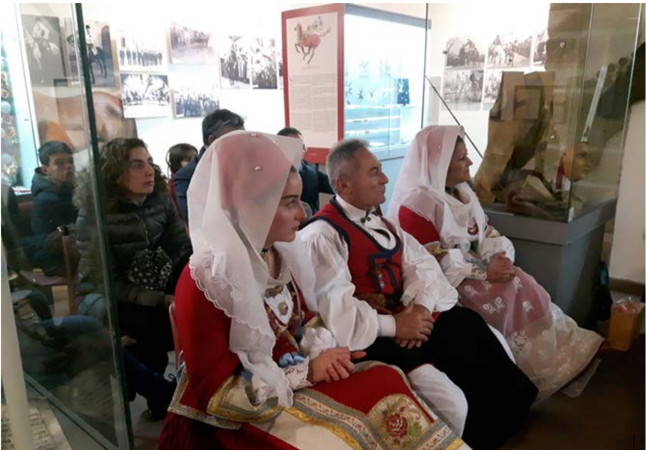
Raccontando la Sartiglia