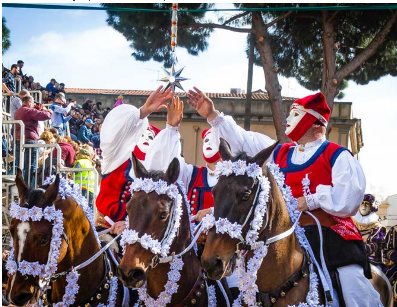
Il corteo dei cavalieri lungo la via Duomo

L'edizione svoltasi nei giorni 26 e 28 febbraio 2017 ha visto, come da previsione, la partecipazione di 120 cavalieri che sotto il comando de su Componidori e la supervisione dei Gremi, hanno dato vita secondo la tradizione alle fasi salienti della Giostra: la Corsa alla Stella e la Corsa delle Pariglie. A queste fasi si sono aggiunti i riti cerimoniali, quale la Vestizione de su Componidori, che inseriscono la Sartiglia in una dimensione di fascino e mistero. La manifestazione, come sempre, ha riscosso grande successo, decretato dalla bellezza, dai colori e dai suoni che ne fanno un avvenimento unico nel panorama dei tornei equestri. Importante è stata l'attenta organizzazione curata dalla Fondazione, che oltre a garantirne la realizzazione, ha permesso al pubblico affluito numeroso di assistere alla plurisecolare giostra equestre oristanese. Positiva come sempre la risposta all'offerta delle agenzie di viaggio e degli albergatori che hanno permesso di ospitare a Oristano un buon numero di visitatori con un ritorno apprezzabile a favore degli operatori di tutta la provincia.