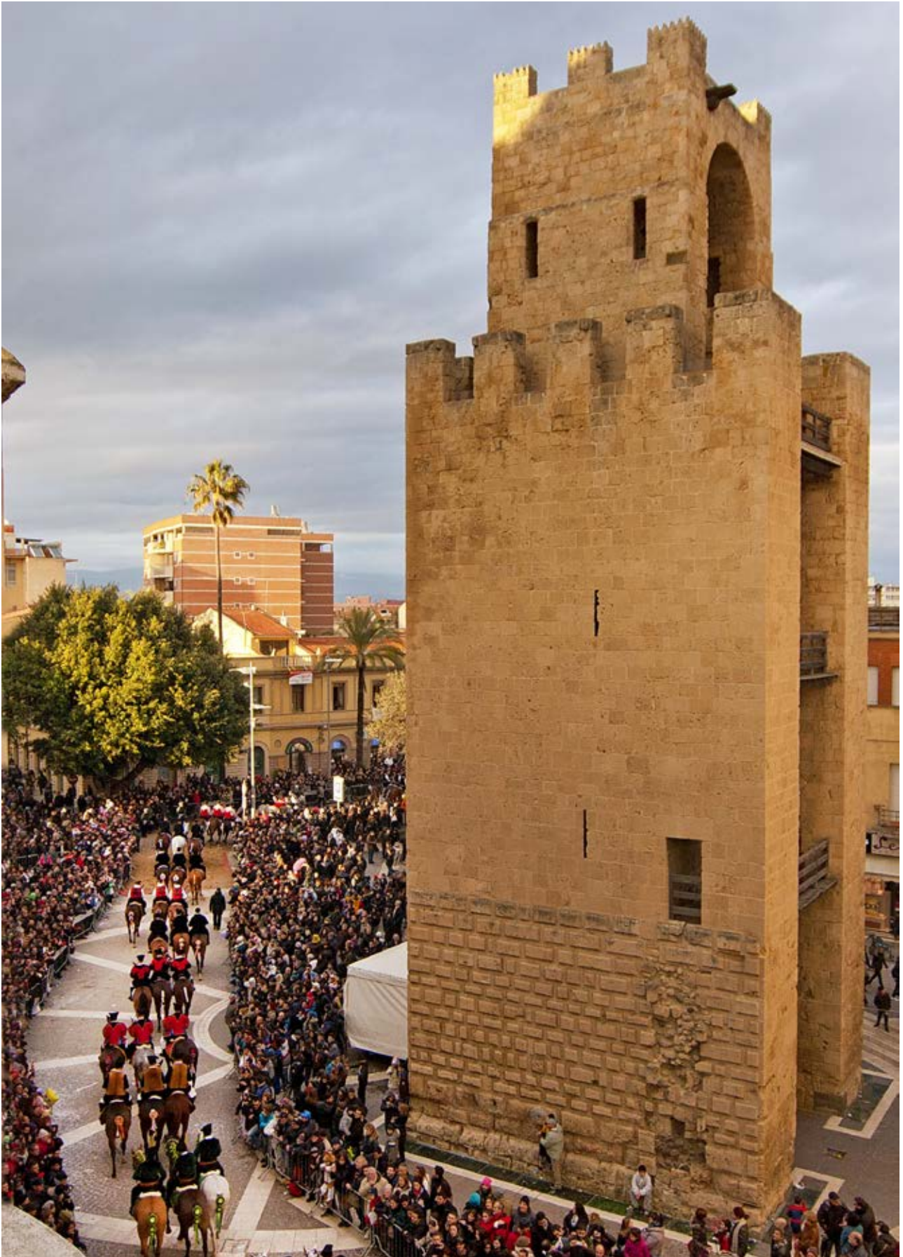
Il corteo della Sartiglia in piazza Roma