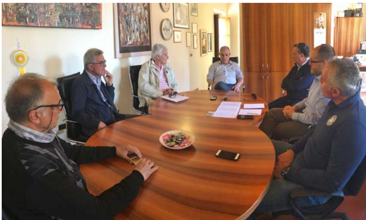
Prima seduta nuovo CdA