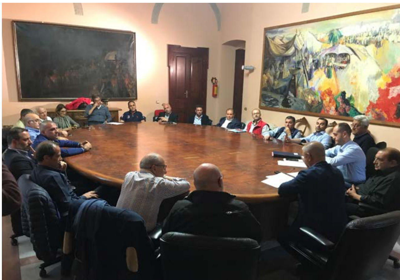
Insedimento Consiglio Generale