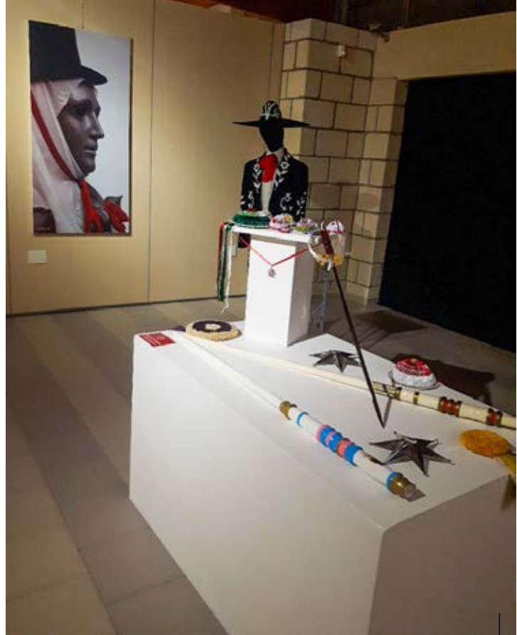
Mostra "Sa Sartiglia – La Sardegna in una stella"