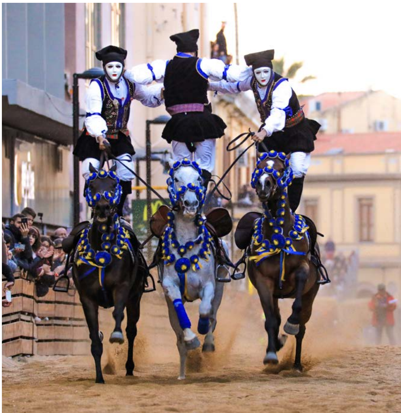
Esibizione di una pariglia in via Mazzini