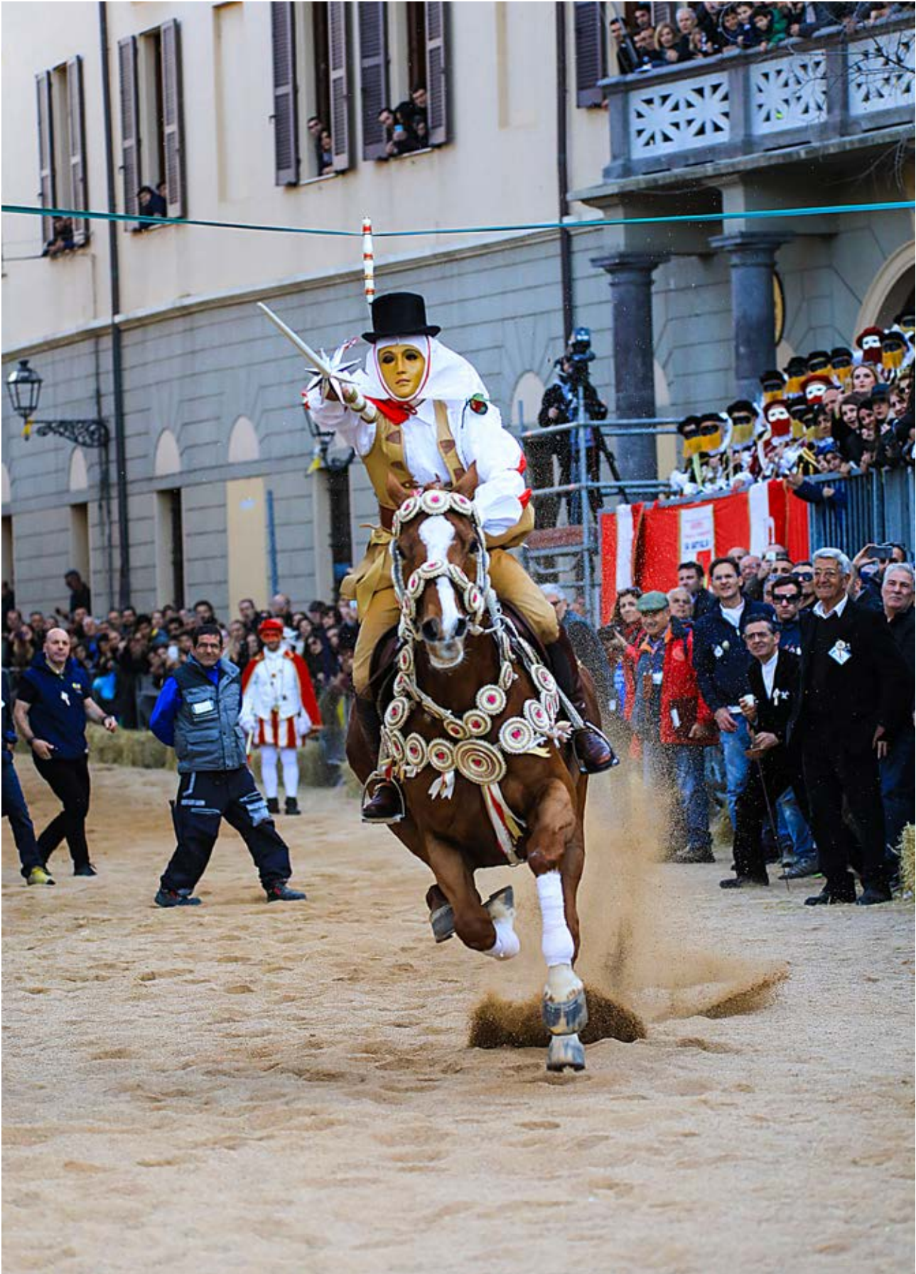
Il Componidori del Gremio di San Giovanni