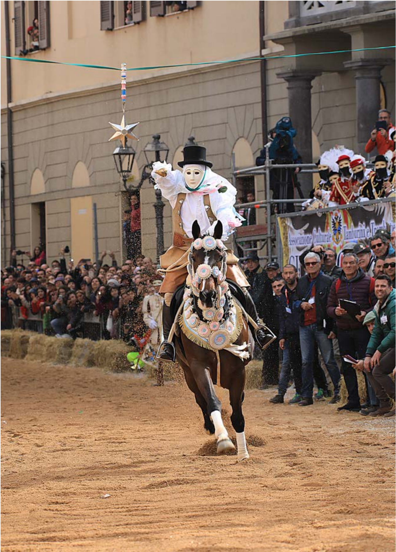
Il Componidori del Gremio di San Giuseppe