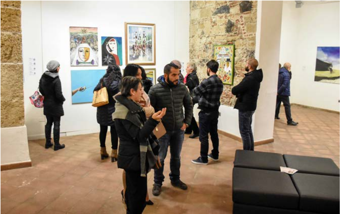
Mostra Emozioni di Sartiglia . Il ediz. del concorso pittorico.