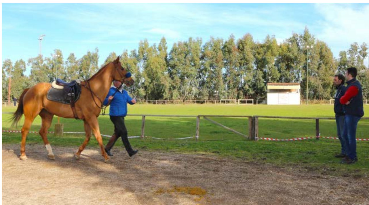
Visite veterinarie Sartiglia 2017