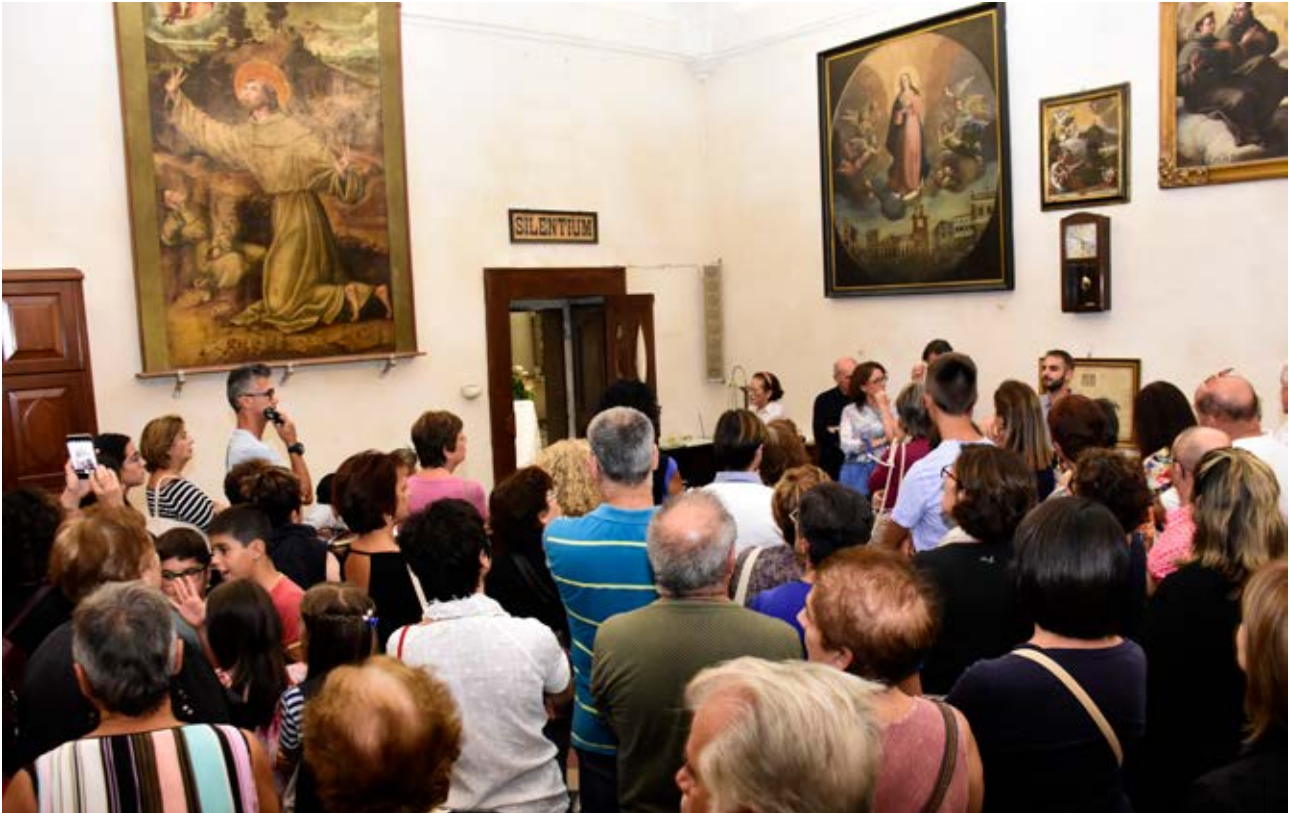
Visita guidata alla chiesa e al convento di San Francesco